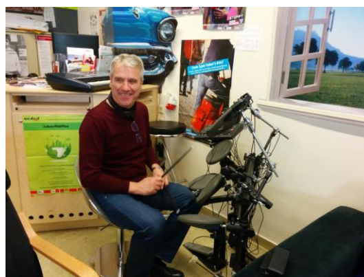
Audzēkņu atpūtas telpā, kurā ir dažādas brīvā laika pavadīšanas iespējas, kā arī patstāvīgi sastopams psihologs, lai atturētu jauniešus no kaitīgiem ieradumiem