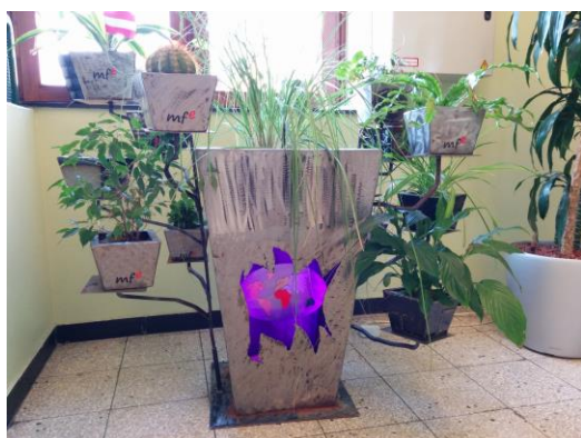
Audzēkņu veidots metāla puķupods skolas kāpņutelpā

Tika diskutēts kā tehniskajās programmās piesaistīt meitenes. Tehniskajās programmās (metālapstrāde, tehniķi, elektronika u.c.) mācās 7-10% meiteņu. Austrijā ir nacionālā “meiteņu diena” profesionālajā izglītībā , kad uzņēmumi aicina meitenes izmēģināt profesijas, pavadot uzņēmumā vienu dienu, lai piesaistītu vairāk darbinieču. Uzņēmumi tiek atbalstīti ar metodisko materiālu palīdzību, kā šādu dienu organizēt.